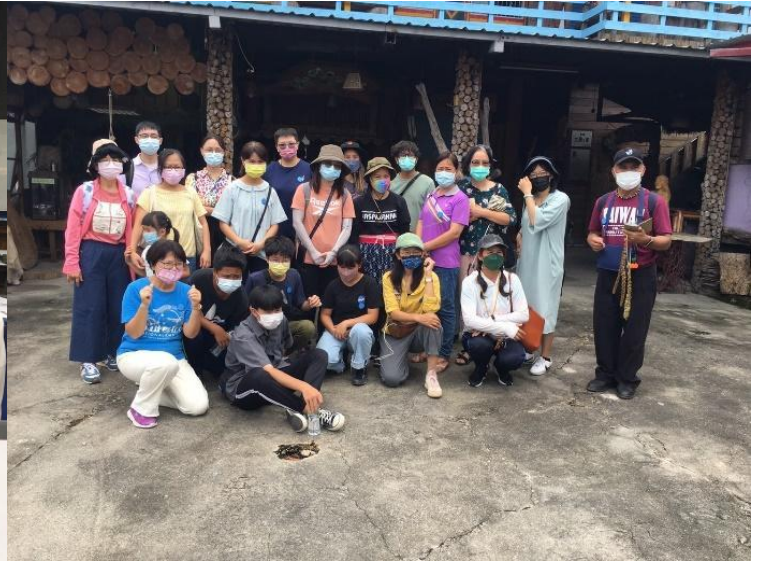
射馬干部落文化導覽合照