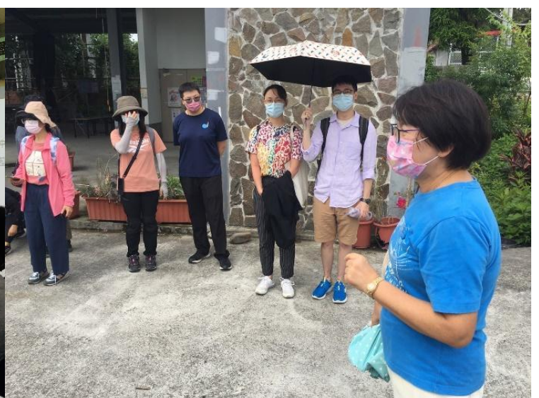
部落踏查:射馬干部落文化導覽