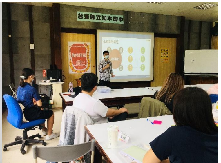
講師講述桌遊基本架構