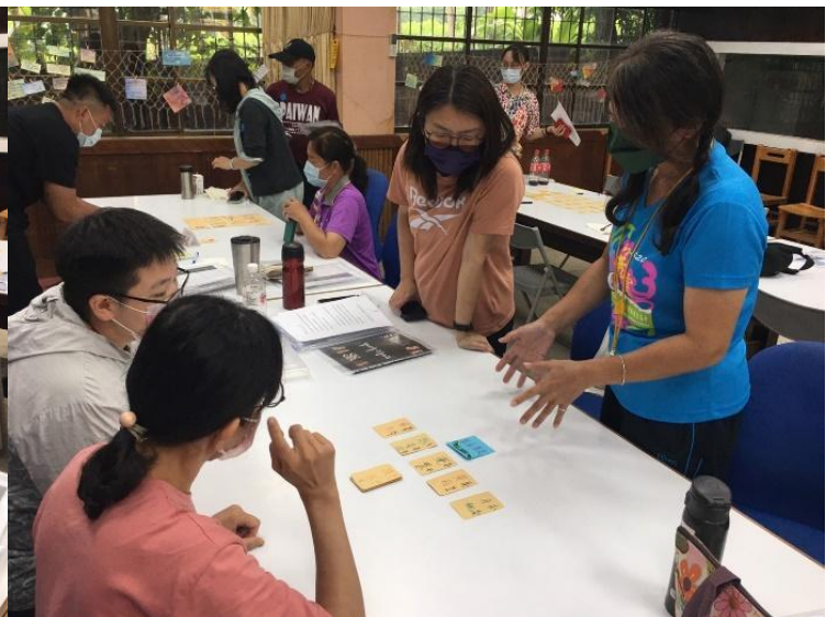
桌遊設計營設計完成分組桌遊闖關