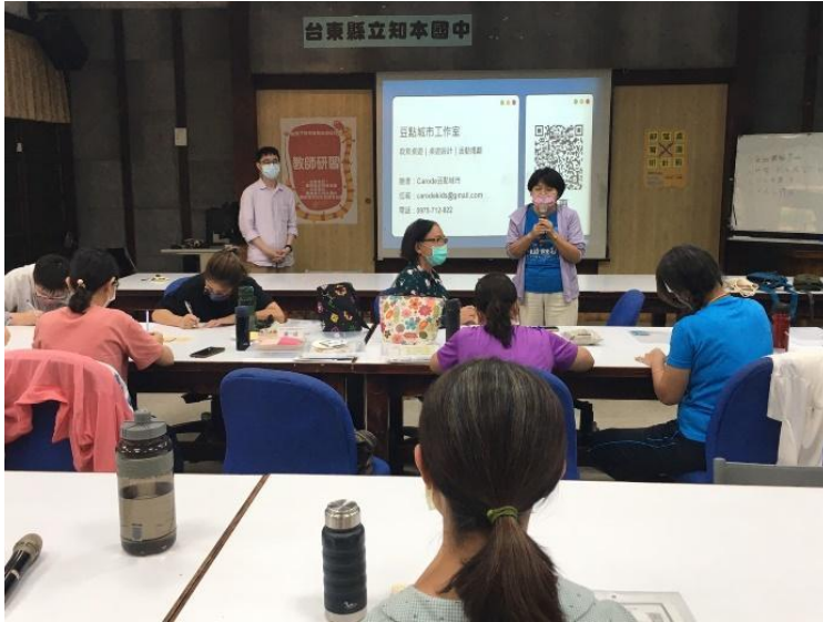
射馬干部落桌遊設計營設計分享