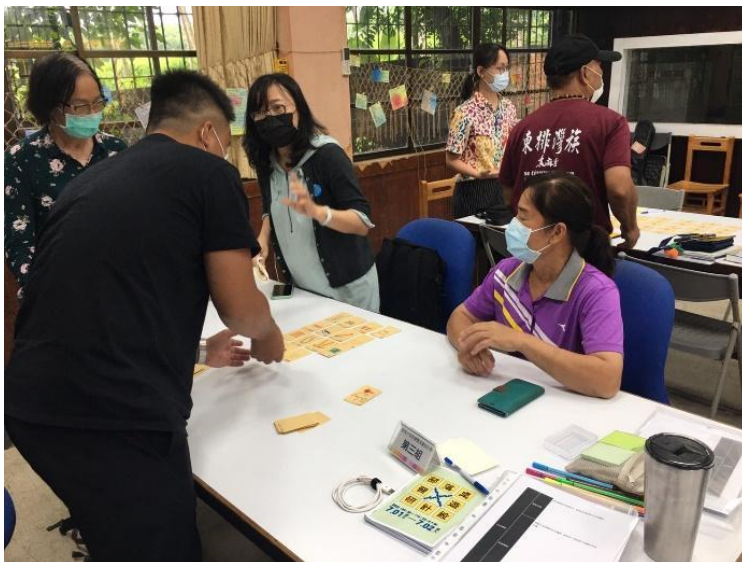
桌遊設計營設計完成試玩與回饋