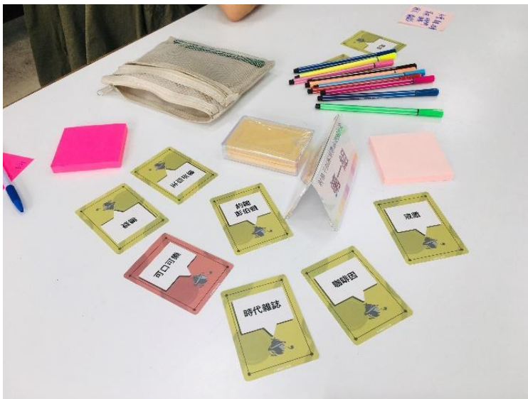
設計桌遊練習準備工具