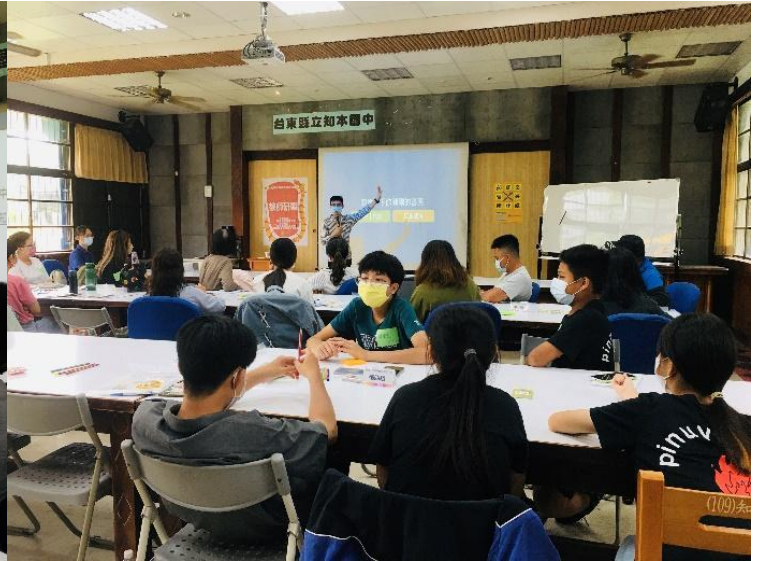
桌遊設計：講述卡片製作