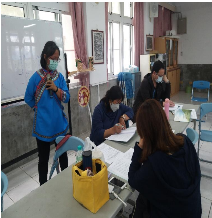
講師指導研習人員實作布農族小米開墾祭儀文本融入國語閱讀策略教學