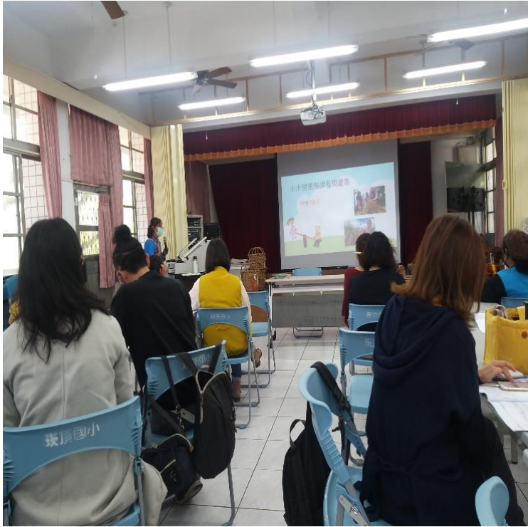
講師說明布農族小米開墾祭儀融入國語領域教學活動規劃及教學策略內容說明