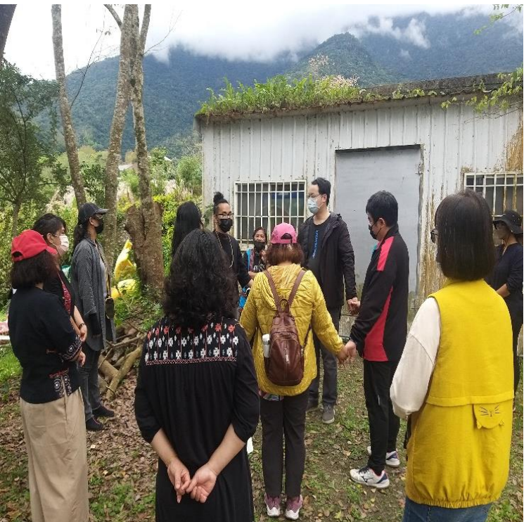
講師指導學員學習與練唱布農族小米相關祭儀歌曲, 並說明每一首歌曲的意義