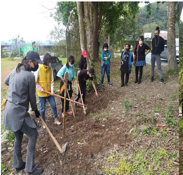
講師說明布農族小米開墾方式與禁忌說明,邊指導學 員手拿鋤頭實作小米田開墾課程