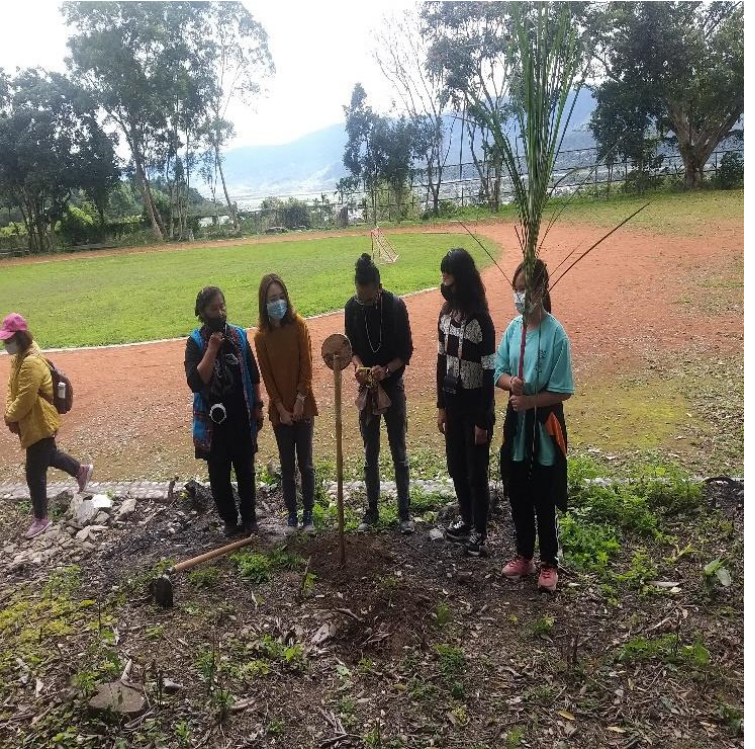
講師指導學員運用祭器及族語祭禱文進行布農族小 米開墾祭儀實作