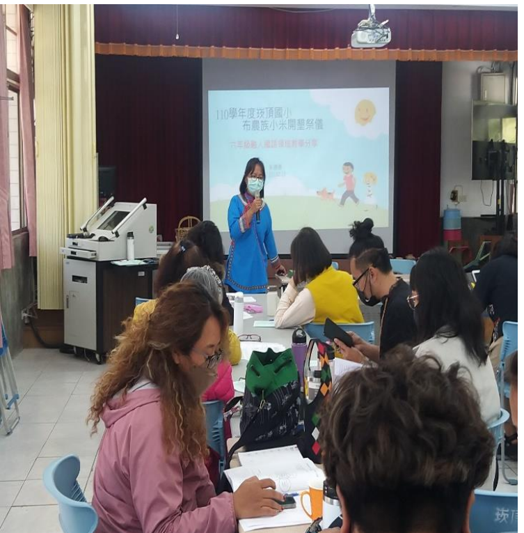
講師說明布農族小米開墾祭儀融入國語領域之架構圖設計說明