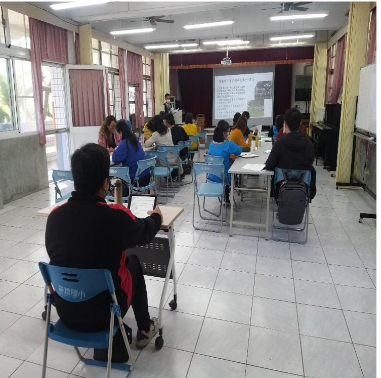
講師說明布農族小米開墾祭儀流程,跨各一般領域師生學習的成果說明