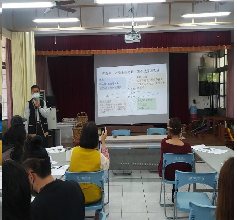
講師說明布農族小米開墾祭儀跨那些一般領域課程之架構圖設計說明