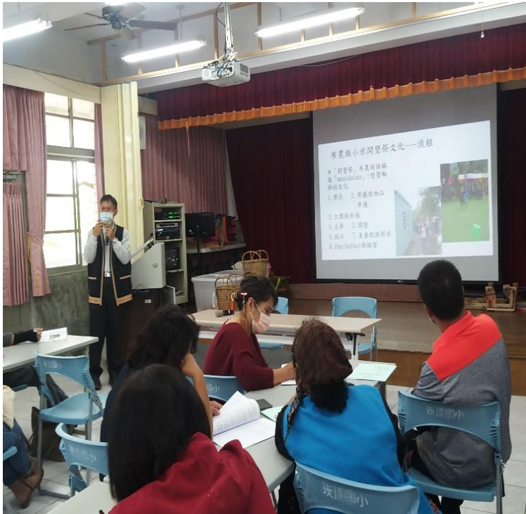
講師說明布農族小米開墾主要的祭儀元素,並依該元素規劃教學活動流程及內容說明