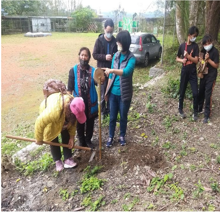
講師指導學員實作布農族小米祭儀立牌儀式及文化 內涵說明