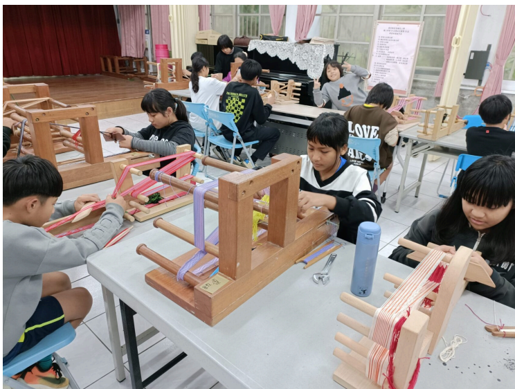
學員織帶實際編織中