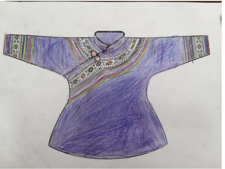
繪製想要的織帶圖案與配色