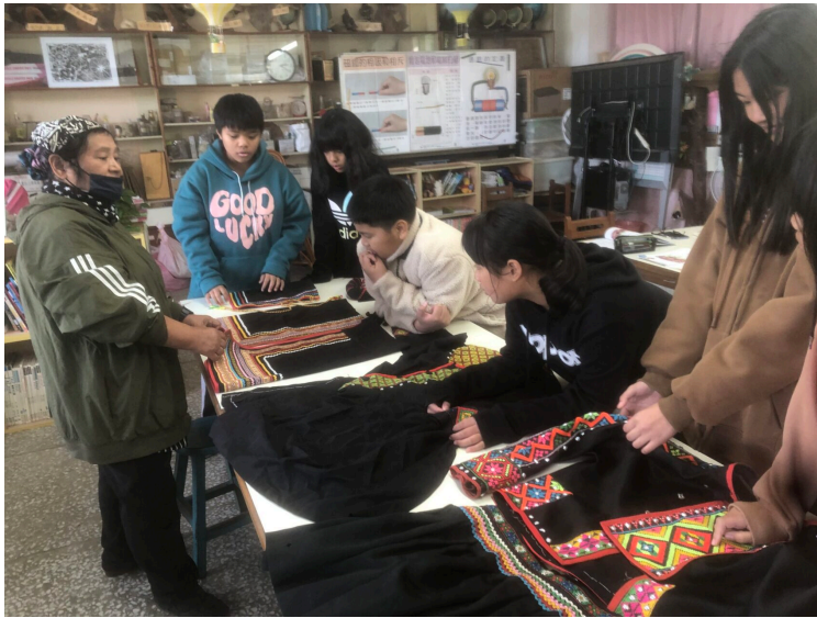
近距離觀察並介紹布農族傳統服飾與圖紋飾品