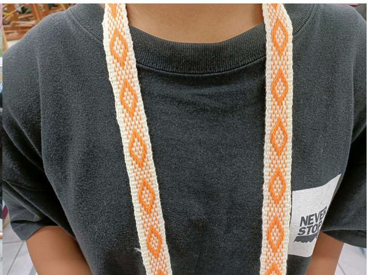
學員編織的織帶完成