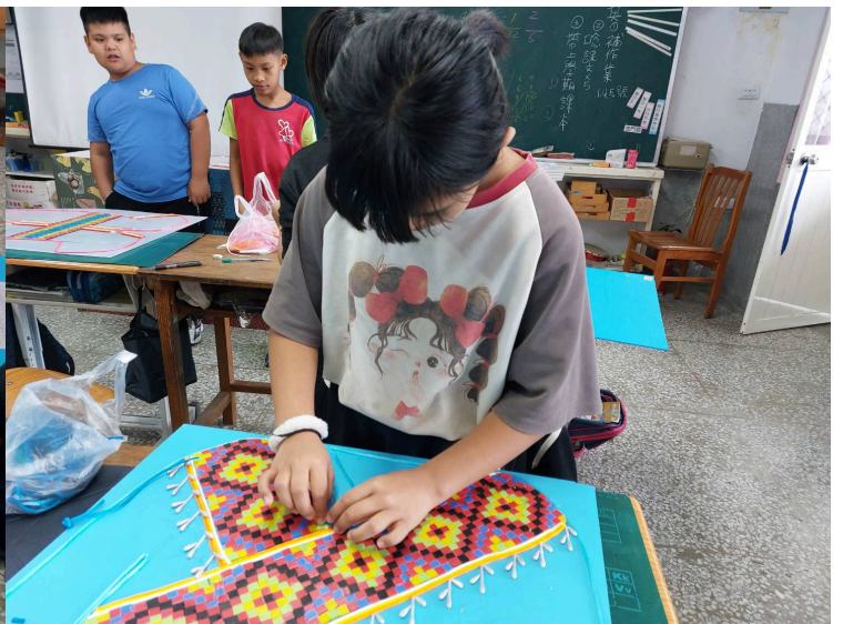
繪製想要的織帶圖案與配色