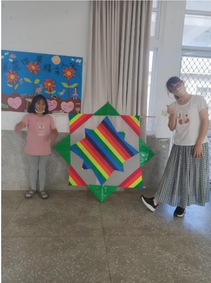
9.大型八角風箏完成