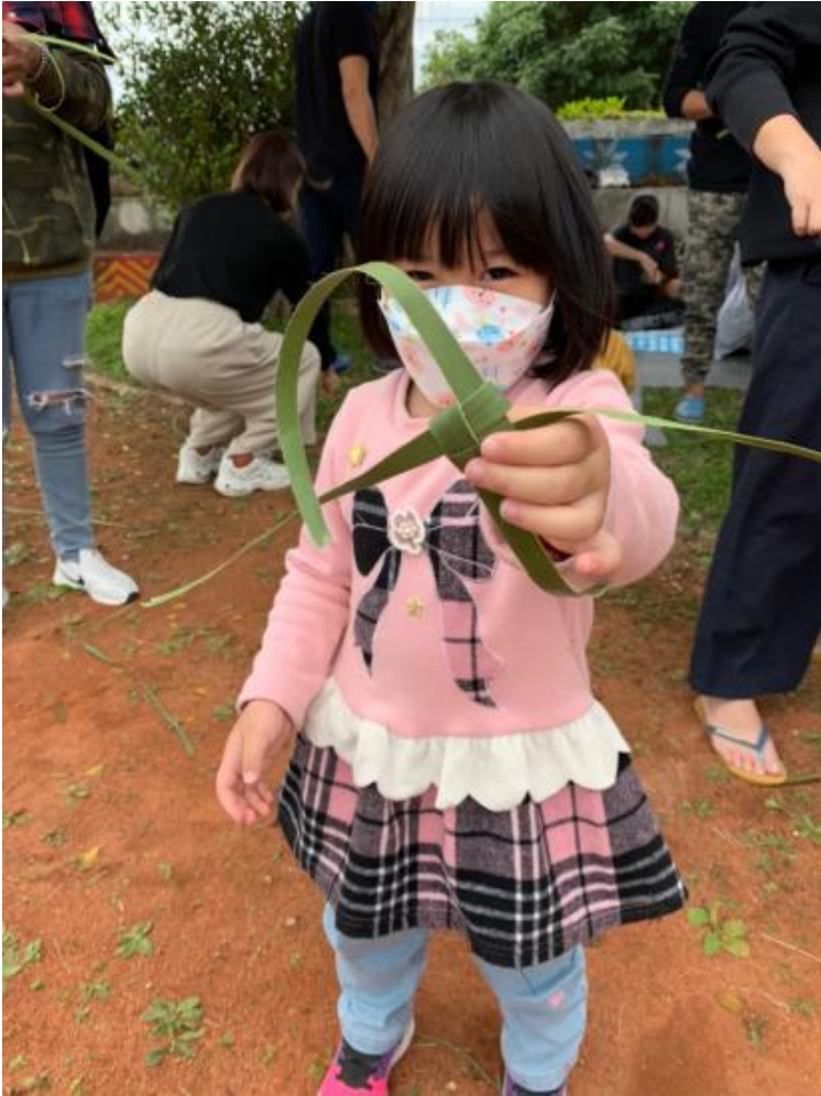
就地取材，以蒲葵葉製作編織小魚