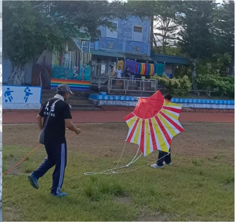
10.八角風箏準備起飛