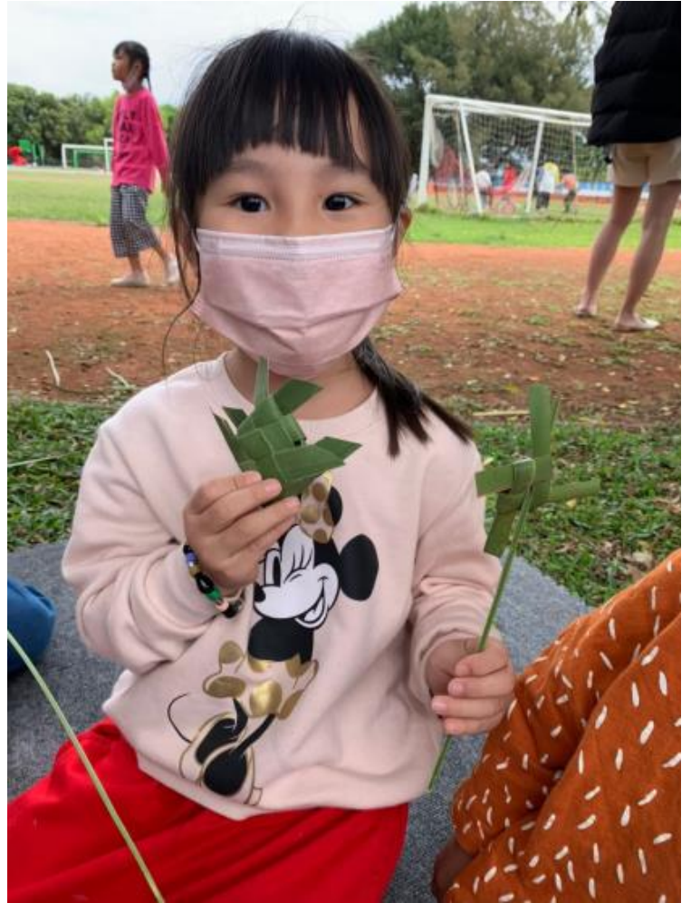
蒲葵葉製作編織小魚成品