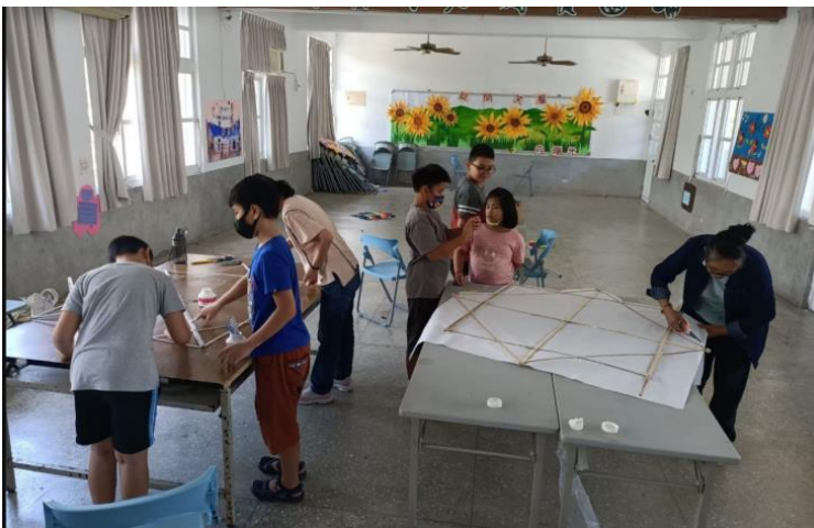
7.共作傳統大型八角風箏