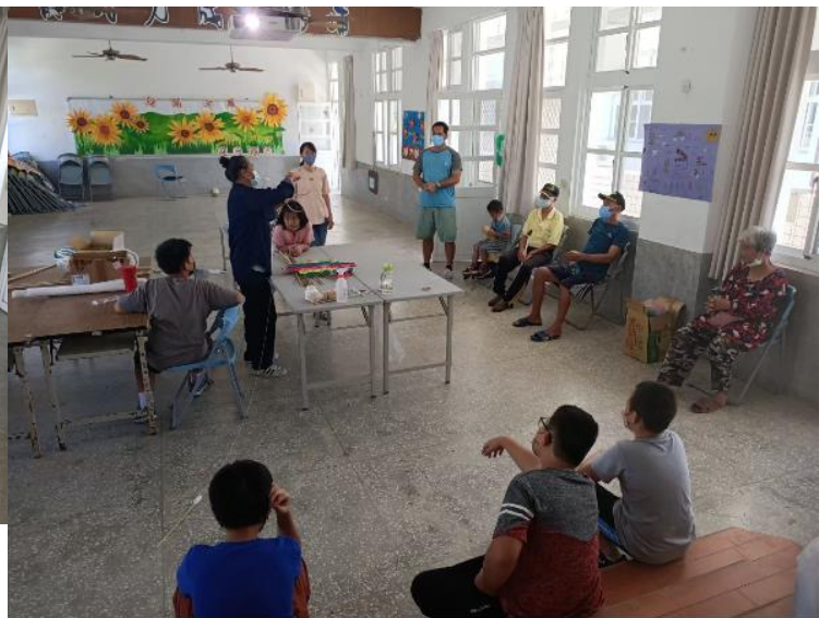
8.老幼共學，共作傳統大型八角風箏