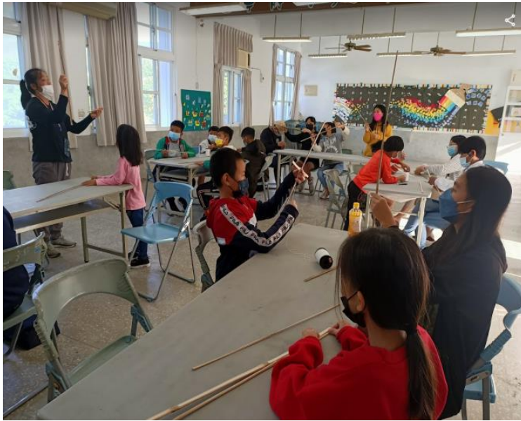
1. 認識風箏製作材料竹子，開始進行風箏支架製作