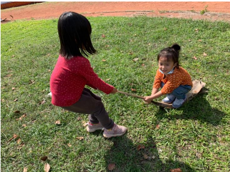
以檳榔葉鞘作為拖拉車