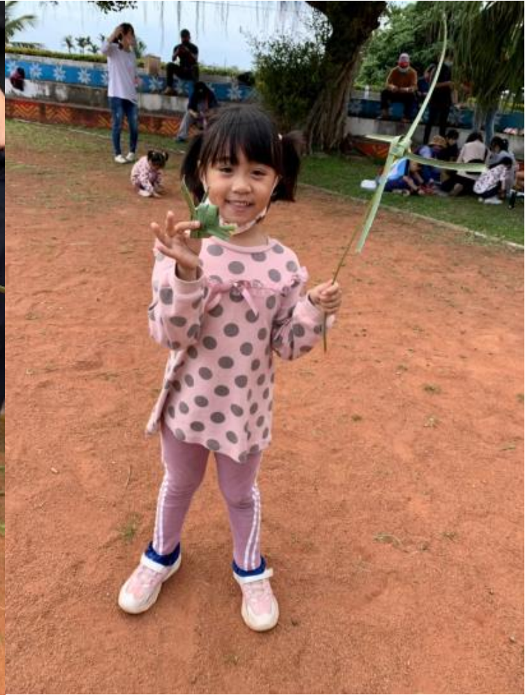
就地取材，以蒲葵葉製作編織小魚